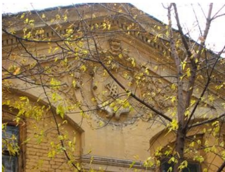
Дом Павла Васильевича Щапова в Б. Демидовском пер. Фрагмент фронтона в вензелем "ПЩ" (Петр Щапов). Фото 2004 г.

На Бауманской улице сохранился дом Щаповых (дом № 58), построенный А.С. Каминским. К этому проекту архитектор привлек своего ученика Ф.О. Шехтеля, который сделал эскизы фасадов и кровли. Внешний вид дома восстановлен при его реставрации.