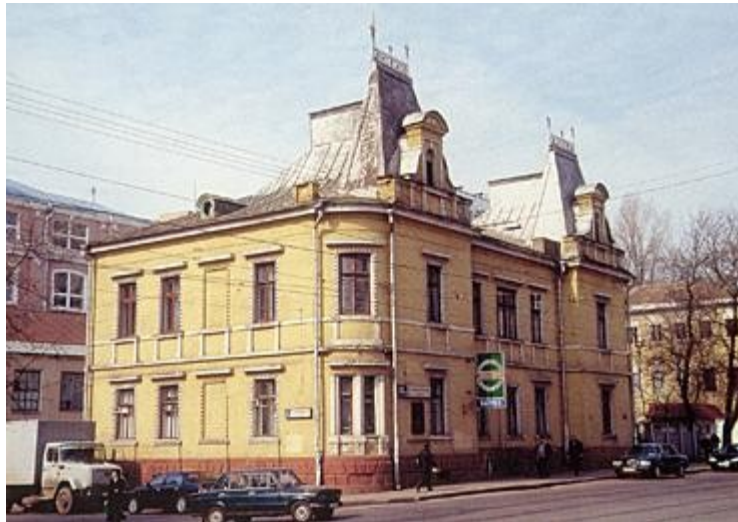
Дом Щаповых. Арх. А.С. Каминский при участии арх. Ф. Шехтеля. 1884

На Бауманской улице сохранился дом Щаповых (дом № 58), построенный А.С. Каминским. К этому проекту архитектор привлек своего ученика Ф.О. Шехтеля, который сделал эскизы фасадов и кровли. Внешний вид дома восстановлен при его реставрации.